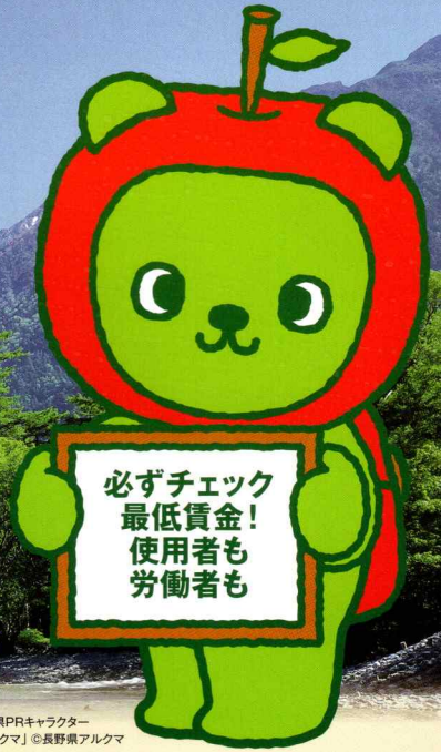
長野県PRキャラクター「アルクマ」©長野県アルクマ

★なお、下記の産業で働く労働者には、それぞれの特定(産業別)最低賃金が適用されます。