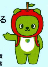
長野県PRキャラクター「アルクマ」©長野県アルクマ

「業務改善助成金」は、生産性を向上させ「事業場内で最も低い賃金(事業場内最低賃金)」の引上げを図る中小企業・小規模事業者を支援する助成金です。設備投資などを行なった場合、支給の要件の応じてその費用の一部を助成します。